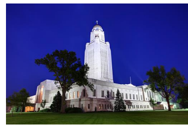
ネブラスカ州リンカーン