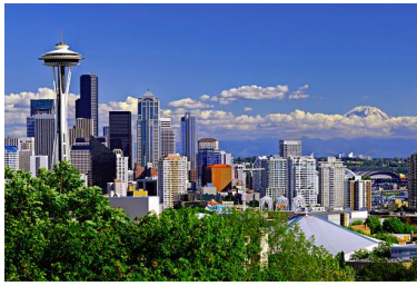
ワシントン州シアトル