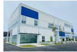
レンタルオフィス