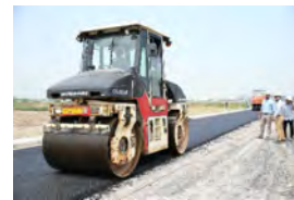
廃プラ利用の道路舗装