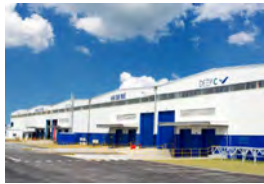
レンタル工場/倉庫