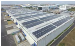
屋根置き太陽光発電