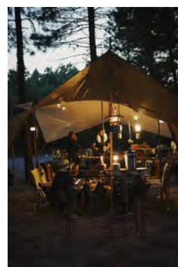
上海近郊のキャンプ場で楽しむ若者

また前述のスポーツ以外にも、キャンプやバーベキューといったアウトドアライフを楽しむ過ごし方も増えてきました。他人との距離をとりつつ、自然を楽しみ癒しを求めるといったキャンプなどの屋外レクリエーションは、アフターコロナのこの時期に最も相応しい趣味だということで、これも爆発的に伸びています。