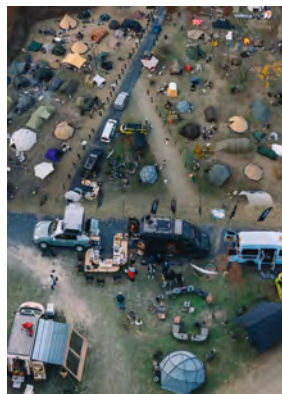
続々と建設されるキャンプ場

例えばキャンプに欠かせないテントというアイテムの市場規模だけでも、2021年には27億元（540億円）だったものが、2026年には91億元（1820億円）になると予測されており、これだけを見てもまだまだこれからの市場といえます。（※出典：观研天下(中国露营帐篷行业发展趋势研究与未来投资分析)）